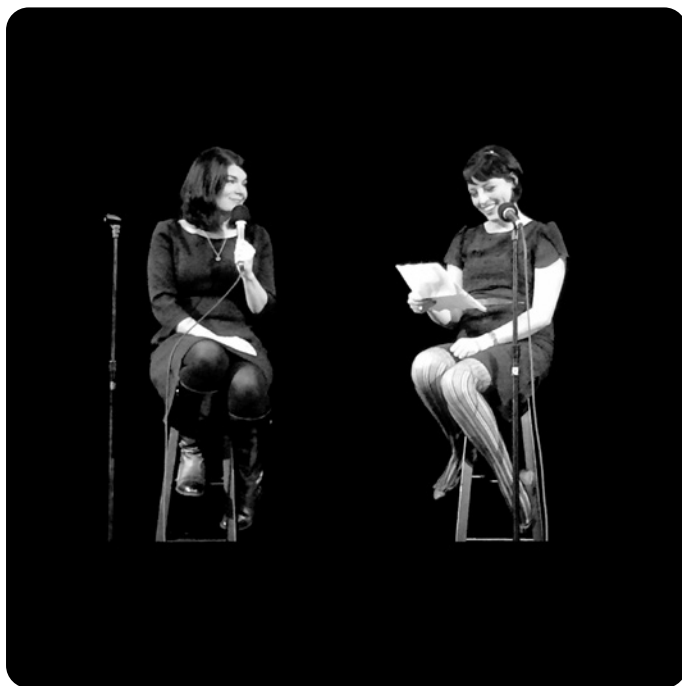
Athenaeum Színház, Chicago, 2016. november

Szóval most, hogy megírtuk ezt a könyvet néhány olyan témáról, amikhez vissza-visszatérünk a műsorunkban, és amik sokat jelentenek mindkettőnknek, a végeredmény kicsit személyes és kicsit zavaros. Tudassátok majd velünk, ha valamit rosszul csináltunk.