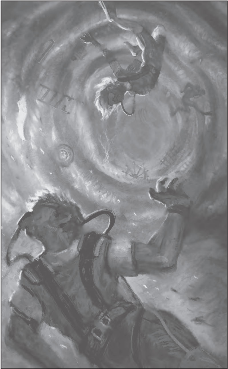
A fenevad gyomrában