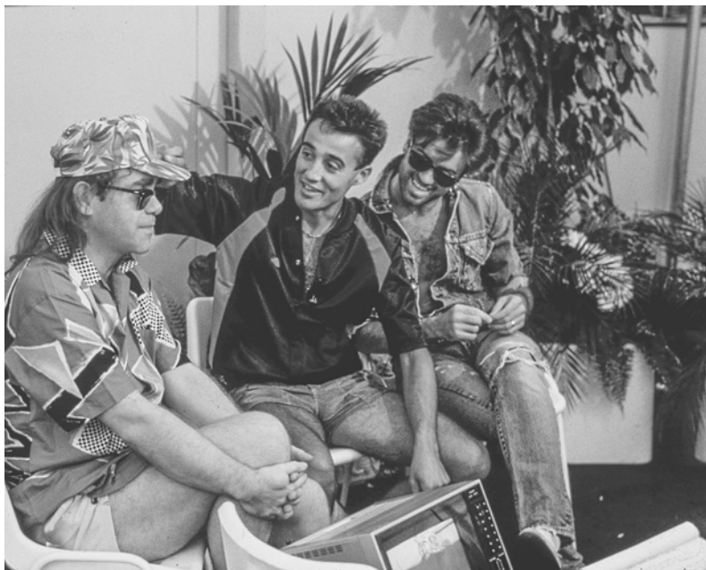
A backstage-ben Eltonnal a Wembley Stadionban 1986. június 28-án

De tökéletesen passzolt ehhez, hogy két évvel később egy újabb Wham!-koncert ért véget úgy, hogy Elton is mellettünk állt. A „Young Guns (Go For It!)”-ot, az első nagy slágerünket és a „Wake Me Up Before You Go-Go”-t, George páratlan, táncrea hívó bulihimnuszát az anarchikus újrázás követte az „I’m Your Man”-nel, amelyre a Duran Duran Simon Le Bonja csatlakozott hozzánk a színpadon vokalistaként. Ahogy lassan elhalt a zene, hetvenkétezer hang fülsiketítő lárma visszhangzott körülöttünk, és utoljára élveztük együtt a dübörgő ovációt. Olyan élményeket éltünk át mi ketten, amelyeket el se tudtunk volna képzelni, amikor hajdan befejeztük az iskolát. De már attól a naptól kezdve egymásra támaszkodtunk.