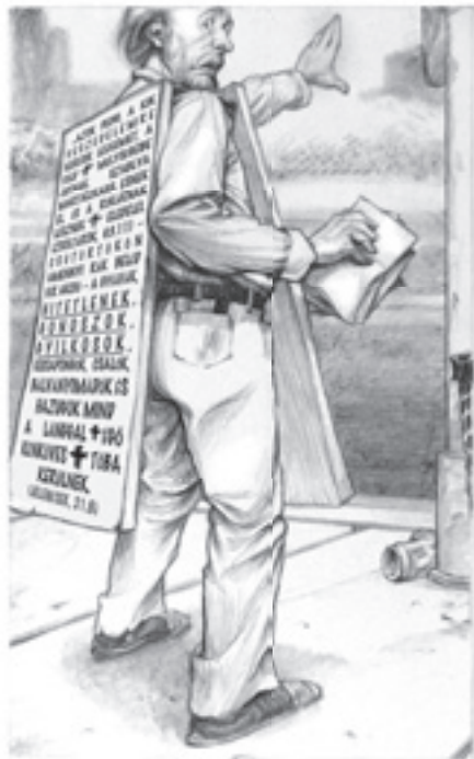
Hal (az invázió előtt)

Teljesen egyedül voltam, anyát ugyanis addigra már magukhoz rendelték a földönkívüliek. A nyakán lévő szemölcsön keresztül üzentek neki. Ketten maradtunk a macskával, és be kell vallanom, hogy egyre jobban nehezteltem rá. Egy ideig cipeltem, de úgy vonaglott a kezemben, mint egy szatyor hal, ezért leraktam. Amikor továbbindultam, jött utánam, de minden egyes alkalommal összerezzent, amikor valaki elrohant mellette, vagy megszólalt egy autóduda, ami szinte másodpercenként előfordult. Lép, lép, rezzen, lép, lép, rezzen, mintha kongát járna. Egy idő után