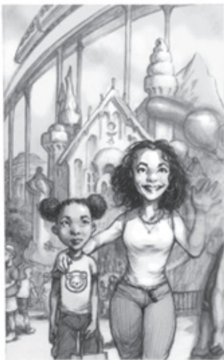
Anya és én, 2011 tavaszán