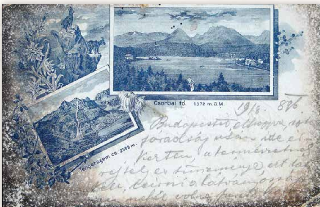
9) A Csorbai-tó látképe és a Tengerszem-csúcs (ismeretlen kiadó, 1896)

„Egészségesek, kik a nyári nagy meleg elől menekülni, vagy a városok poros, bűzös atmosphaeráját tiszta, illatos levegővel felcserélni, vagy az alföld maláriás emanációit kikerülni akarják, vagy olyanok, kik egészséges, de gyenge testüket hegymászás, hideg fürdők, és légköri gyors változások behatása által erősíteni, edzeni, vagy hízásra való hajlamukat csökkenteni kívánják, alig választhatnak e végre alkalmasabb s a mellett kellemesebb helyet, mint a csorbai tavat.” 2