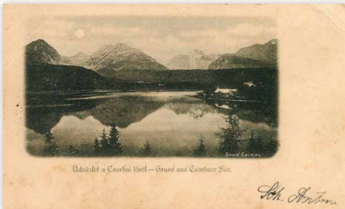
22) Üdvözlét a Csorbai-tóról