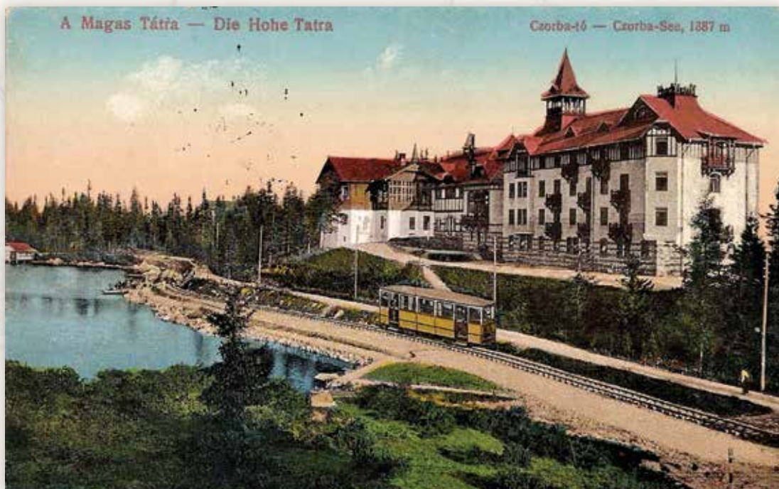
16) A villamosvasút a vendéglő és a Nagyszálló előtt (Divald és Monostory, 1917)

1912 augusztusában helyezték forgalomba a Tátrai Helyi Érdeklő Villamos Vasút (THÉVV) utolsóként megépült szakaszát Tátraszéplak és Czorbató között. A villamos végállomása a Nagyszálló közelében, az egykori Augusztá villa (ma Hotel Solisko) mellett volt (lásd a következő képeslapon), utolsó szakaszán a tó déli partján, a vendéglő és a Nagyszálló előtt haladt végig. Napjainkban a villamosvasút végállomása a település központjában, a Hotel Crocus mellett található.