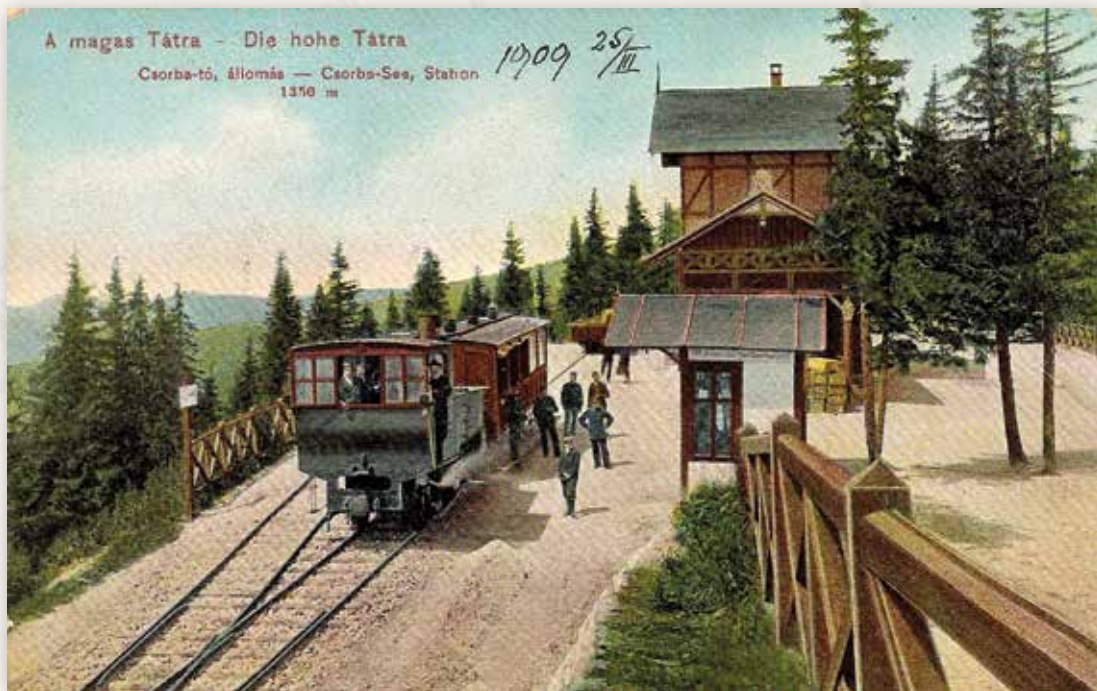
14) A fogaskerekű vasút állomása (Dr. Trenkler Co., 1906)

1896. július 28-án adták át a forgalomnak a Csorba állomást Csorbatóval összekötő fogaskerekű vasutat, melynek végállomása a tó déli oldalán, az egykori Auguszta villa (ma Hotel Solisko) mellett felépített, mai is álló állomás épülete előtt volt, ami az egyik következő képeslapon látható. Ezt a fogaskerekű vonalat 1933-ban megszüntették, ezután 1970-ig autóbusz közlekedett Csorba és Csorbató között. 1968–1970 között, az akkor megrendezett északi sívilágbajnokság kapcsán építették újjá a ma is működő fogaskerekű vasút pályáját.