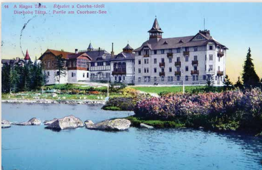
28) A Nagyszálló és a vendéglő északról (Divald és Monostory, 1916)

1901-ben a Szentiványi család birtokában lévő telepet a magyar királyi kincstár vásárolta meg, és bérbe adta a Nemzetközi Hálókocsi Társaság által létesített Magyarországi Szálló- és Fürdővállalatnak. Az ezután megkezdődött fejlesztések első lépéseként 1905-ben a tó déli partján, a Csorbató Szálló és a turistaház helyén felépült az 54 szobás Nagyszálló. Az új épületet összekötötték a lebontott Csorbató Szállóhoz 1892-ben hozzáépített vendéglővel. Egy évtizeddel később, 1914 és 1917 között a régi kávéház és a Bazar helyén felépítették az új kávéházat, amelyet a szállóval tágas hall kötött össze. A Nagyszálló 64 szobás, az étteremhez csatlakozó keleti szárnya 1916 és 1922 között épült fel. Az épületkomplexum a rendszerváltásig gyógyüdülőként működött, napjainkban a Magas-Tátra luxuskategóriájú szállodája, a Grand Hotel Kempinski épületegyütteséhez tartozik. „Szentiványi-Csorbató állami magaslati gyógybely. A Tatra gyöngye. A Magas-Tátra déli lejtőjén 1356 m. tsz. f. Javalva: vérszegénység, idegesség, légzőszervi bántalmak ellen és Basedow-féle kórnál. Elsőrangú hotelek. Villamos világítás, központi fűtés. Posta, távirda- és távbeszélő-állomás a telepen. Idény: június 1-től szeptember végéig. Felvilágosítással szolgál a Fürdőigazgatóság” 12