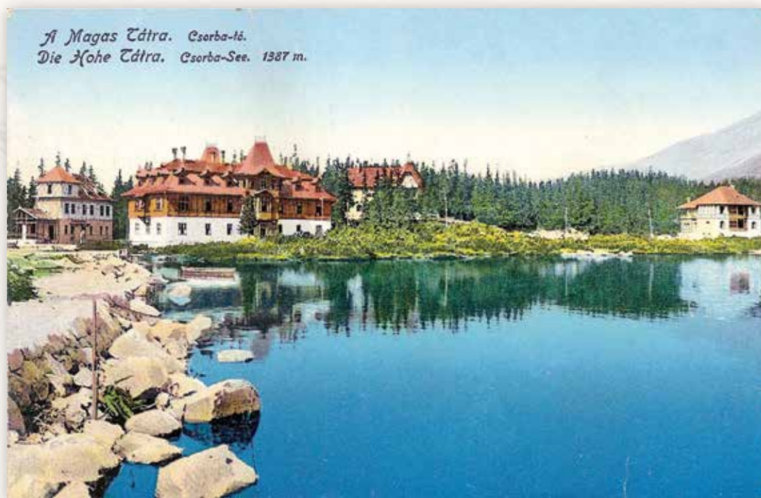
17) Az állomás, az Augusztá villa, a Mária Terézia villa és a Tivoli (Divald és Monostory, 1912)

Az 1917-ben kiadott, „Nagyságos Molnár Sárika úrlánynak”, Budapestre küldött képeslap üdvözlő szövege: „Már elhagytam az ágyat, de aztán meggondoltam a dolgot és visszafeküdtem. Nagyszerű időjárás van most itt – a meghűlésre. Mindnyájukat a lehető legszívélyesebben üdvözlöm...”