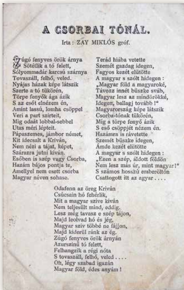
5) A Csorbai tónál – Zay Miklós verse egy 1902-ben postára adott levelezőlapon

A Szentiványi család birtokában lévő területet a magyar királyi kincstár 1901-ben vásárolta meg Szentiványi Árpádtól, majd bérbe adta a Nemzetközi Hálókocsi Társaság által létesített Magyarországi Szálló- és Fürdővállalatnak. Ezután kezdődött a település nagyarányú fejlődése, 1905-ben a tó déli partján felépült a Nagyszálló, majd 1917-ben a kávéház. A Tátra keleti oldalán fekvő Tátralomnic, valamint a legkönyebben megközelíthető Ótátrafüred mellett a hegység nyugati szélén Csorbató lett a tátrai fürdő- és kirándulóvendégek legkedveltebb célpontja. A Nagyszálló keleti szárnyának építését az I. világháború előtt kezdték meg, majd 1922-ben fejezték be. Az első világháború után tovább fejlődött a település, a turisták kiszolgálása céljából több turisztaszállót, éttermet építettek. A Nagyszálló a második világháború után gyógyszállóként működött, a napjainkban eredeti formájában felújított épület a Magas-Tátra első ötcsillagos szállodája, a Grand Hotel Kempinski épületegyüttesének része.