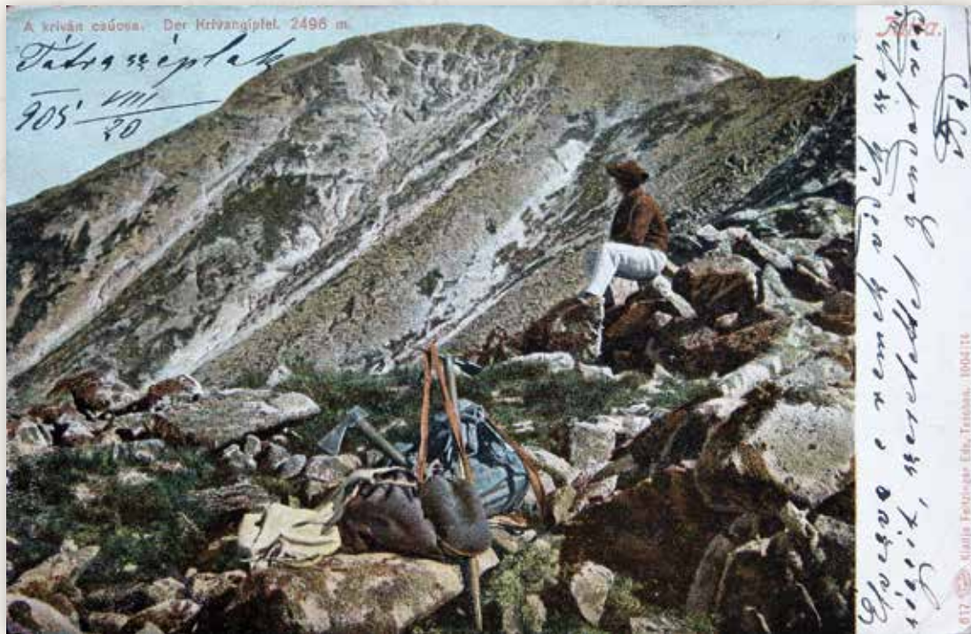
3) A Kriván csúcsa (Feitzinger E., 1904)