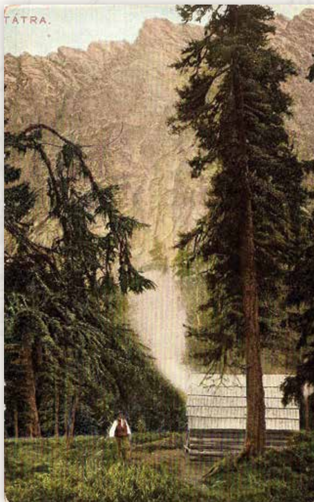
1) A Tábortűz kunyhó (Feitzinger E., 1905)

1895-ben a Krakkói Tátra Egyesület állíttatta a fenti képeslapon látható esőbeálló kunyhót a Hlinszka-völgyben. A nyitott kunyhót közvetlenül a Fenyves-patak északi partja felett építették, kb. 250 méterre a Fenyves- és a Hlinszka-patak összefolyásától. A kicsiny kunyhó állandó látogatói főleg a lengyel turisták voltak, ők nevezték el Tábortűz kunyhónak (Vatra). A fából készült, ajtó nélküli kunyhó 1924-ben leégett.