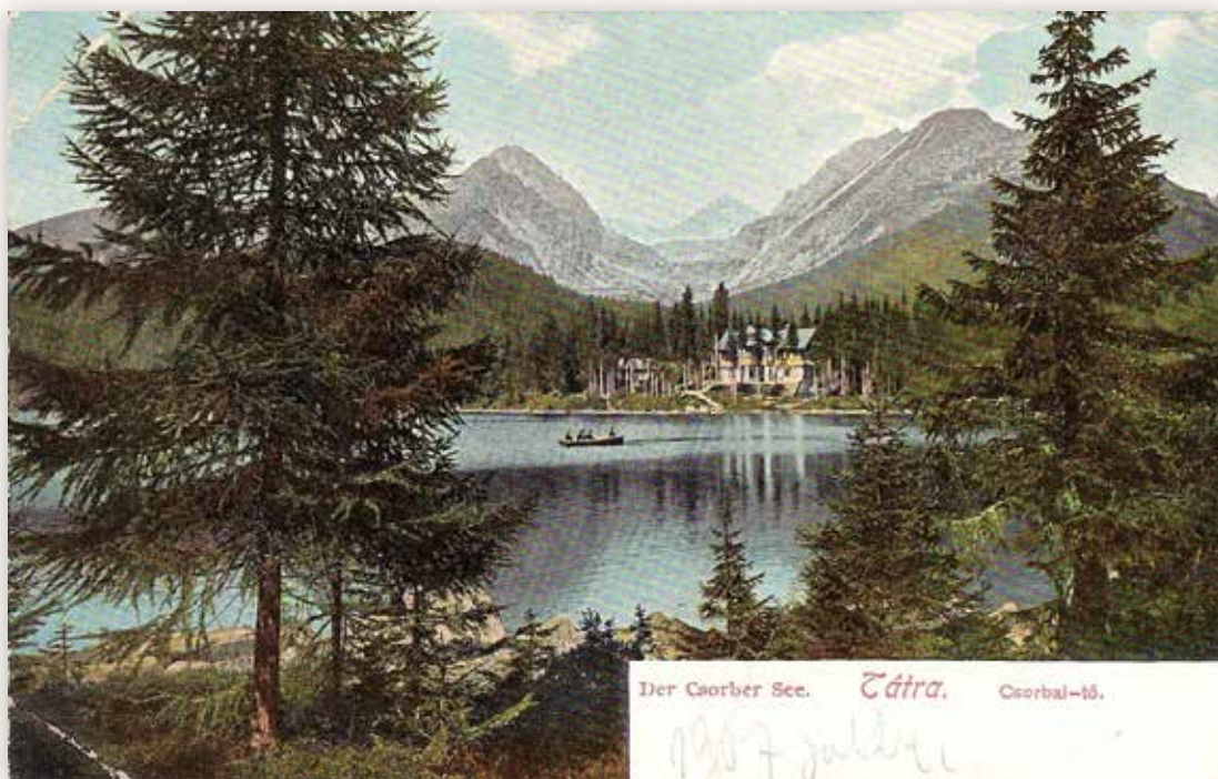
26) A tó túlsó partján a Laszkáry villa (Feitzinger E., 1907)

„Meleg kádas- és fenyőfürdők, villamos zuhanyok, hideg fürdők s uszoda a tóban. Nagy étkező-termek, kávéház billiárdtal, társalgó- és olvasóterem. Kirándulásokhoz képzett és megbízható vezetőik, bérkocsik és hátaslovak készletben tartatnak. A fürdőből jó kocsit vezet Ó- és Új-Tátrafüredre.” 4