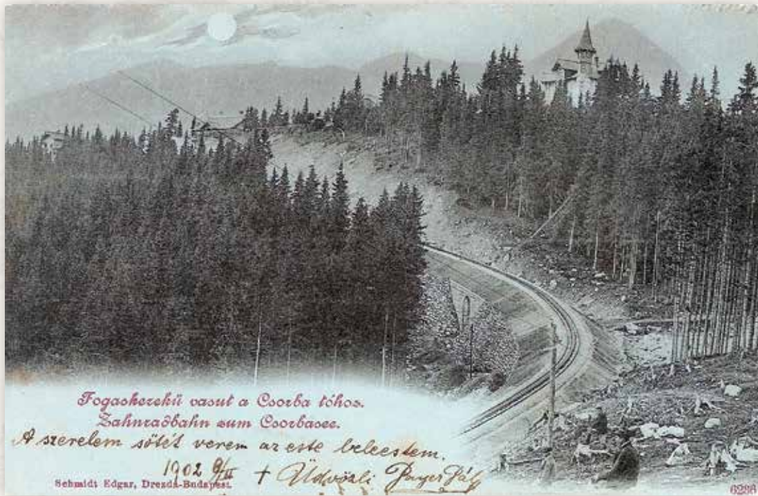
12) A fogaskerekű pályájának felső szakasza (Schmidt E., 1902)

A drezdai székhelyű nagy német képeslapkiadó Budapesten is fiókirodát tartott fenn, amely az egész országról, így a Magas-Tátráról is igen jó minőségű fekete-fehér lapokat adott ki. Az itt látható képeslap az ún. „holdfényes” (mondschein) lapok kategóriájába tartozik, amelyeknél a kép témáját kékes tónusú, sejtelmes, holdvilágos esti megvilágításban láthatjuk.