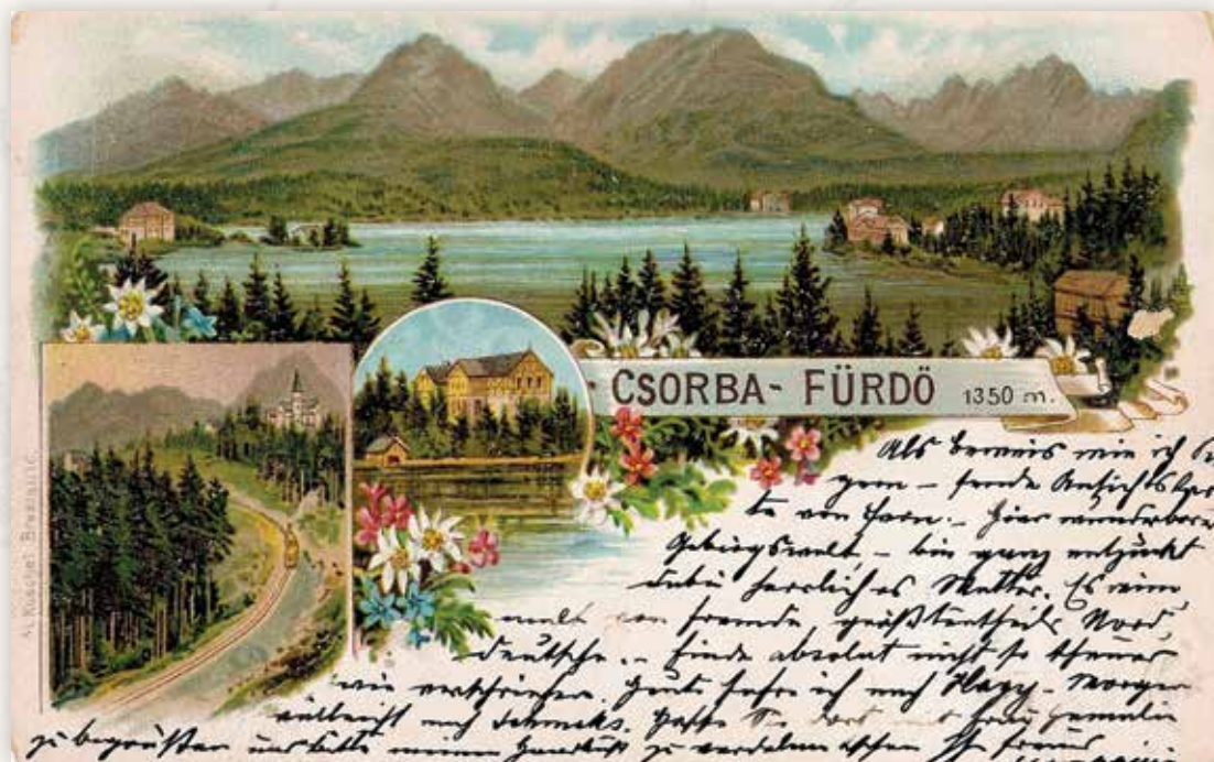
8) Csorbai-tó (, 1899 körül)