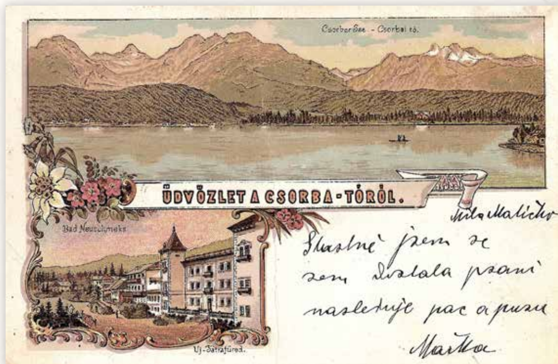
11) Üdvözlét a Csorbai-tóról (ismeretlen kiadó litográfia, 1898)

1898. június 17-én a Poprád melletti Virágölgyből Nagyszombatba írták az alábbi üdvözlét: „Mélyen Tisztelt Nagyságod! Ma ide ki tettem kirándulást; 1 órányi út, aztán a fent megjegyzett hegyre mentünk, mert hárman voltunk. Vasárnapra tervezünk kirándulást a Csorbai-tóhoz, de szép időre lenne szükségünk, mert tegnap és ma nagyon hideg van itt.”