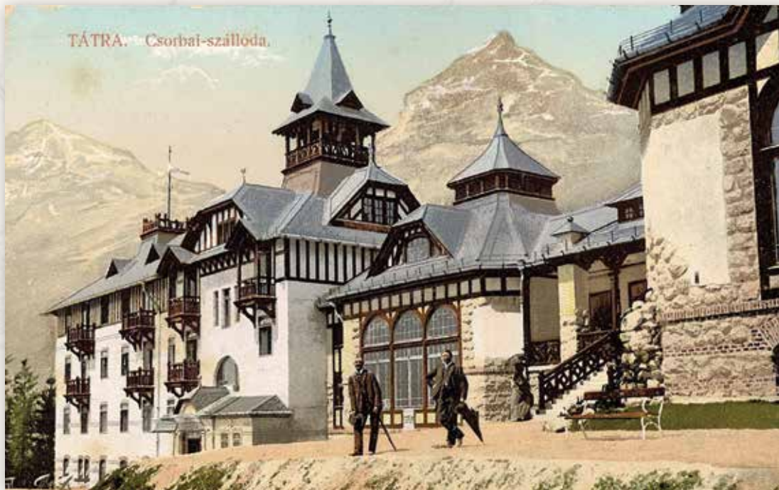
27) A Nagyszálló délről (Feitzinger E., 1908)

1901-ben a Szentiványi család birtokában lévő telepet a magyar királyi kincstár vásárolta meg, és bérbe adta a Nemzetközi Hálókocsi Társaság által létesített Magyarországi Szálló- és Fürdővállalatnak. Az ezután megkezdődött fejlesztések első lépéseként 1905-ben a tó déli partján, a Csorbató Szálló és a turistaház helyén felépült az 54 szobás Nagyszálló. Az új épületet összekötötték a lebontott Csorbató Szállóhoz 1892-ben hozzáépített vendéglővel. Egy évtizeddel később, 1914 és 1917 között a régi kávéház és a Bazar helyén felépítették az új kávéházat, amelyet a szállóval tágas hall kötött össze. A Nagyszálló 64 szobás, az étteremhez csatlakozó keleti szárnya 1916 és 1922 között épült fel. Az épületkomplexum a rendszerváltásig gyógyüdülőként működött, napjainkban a Magas-Tátra luxuskategóriájú szállodája, a Grand Hotel Kempinski épületegyütteséhez tartozik. „Szentiványi-Csorbató állami magaslati gyógybely. A Tatra gyöngye. A Magas-Tátra déli lejtőjén 1356 m. tsz. f. Javalva: vérszegénység, idegesség, légzőszervi bántalmak ellen és Basedow-féle kórnál. Elsőrangú hotelek. Villamos világítás, központi fűtés. Posta, távirda- és távbeszélő-állomás a telepen. Idény: június 1-től szeptember végéig. Felvilágosítással szolgál a Fürdőigazgatóság” 12