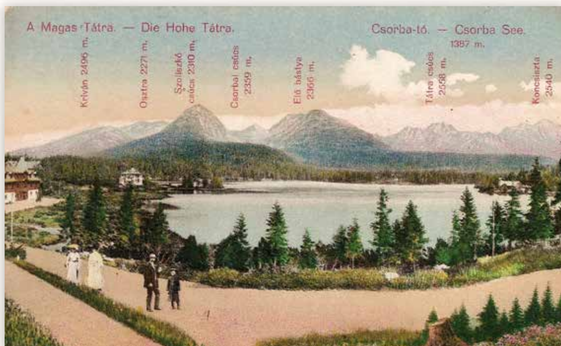
19) A tavat körülvevő csúcsok panorámája a Krivántól a Koncsisztáig (MSM, 1910)

A kép jobb szélén a Csorba-tó Szálló látható, homlokzatán a „SZÁLLODA HOTEL” felirattal. Miután 1885-ben a telepet felvették a gyógyfürdők sorába, ebben az 1880-ban épült négyszobás épületben rendezték be a fürdőigazgatóság irodáját. A szállóhoz 1892-ben építették hozzá a tópart irányában a vendéglőt, ennek üvegezett verandáját láthatjuk a kép jobb szélén. A szálló mellett, a kép közepén álló fák koronája fölött az 1890-ben épült Mária Terézia villa teteje, ettől balra pedig az 1881-ben épült turistaház látható. A képeslap bal szélén a fogaskerekű vasút állomása, valamint egy, a végállomáshoz közeledő, füstöt eregető szerelvény látható.