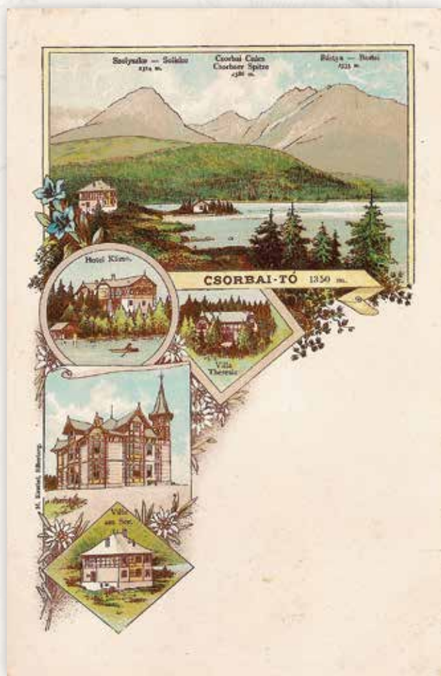
10) Csorbai-tó (Kuschel M. litográfia, 1898 k.)

Ez a képeslap a meglehetősen ritka, álló alakú litografált képeslapok közé tartozik, ilyeneket főleg az alsó-sziléziai Silberbergben (ma Srebrna Góra) működő Kuschel Kiadó adott ki 1898 körül.