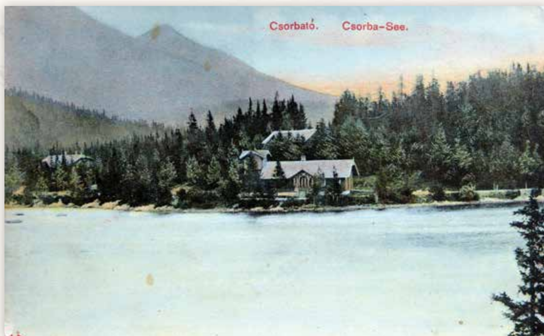
20) A fürdőház és a József menedékház (Quirsfeld J., 1907)

Az 1907 augusztusában Nagykárolyba küldött képeslap üzenete a következő: „Még mindig itt vagyok, ma du. 1/2 4-kor indulok omnibusszal Széplakra. Az idő kátisztult és felmelegedett, már az árnyéket keresi az ember. Egy olcsó (3K) szobát kaptam a Móry-telepen, ott a koszt is olcsóbb és jobb, mint a fényes éttermekben. Lehet, hogy egy hét múlva ide visszajövök, mert ez a legmagasabb fürdőhely. Cs.M.”