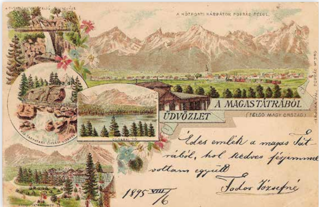
Üdvözlő a Magas-Tátrából (Geruska P. litográfia, 1895)