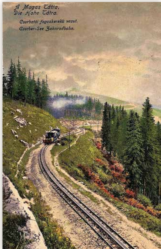
13) A fogaskerekű úton a Csorbai-tó felé (Divald és Monostory, 1918)

1909 júliusában Ráckevére „Nagys. Zentay nővéreknek” írták az alábbi rövid üzenetet: „Szíves üdvözlötet küld fáradtan a mesés vidéket járó X Csorbató, 909 VII/6.”