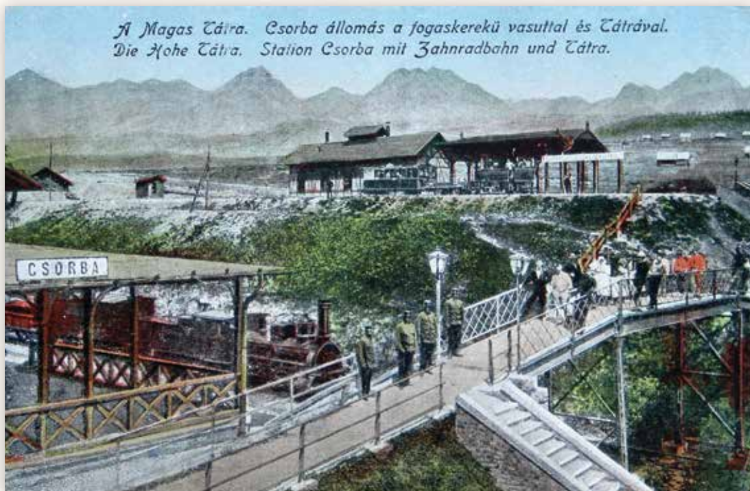
15) Csorba vasúti állomás, felül a Csorbai-tó felé közlekedő fogaskerekű állomása