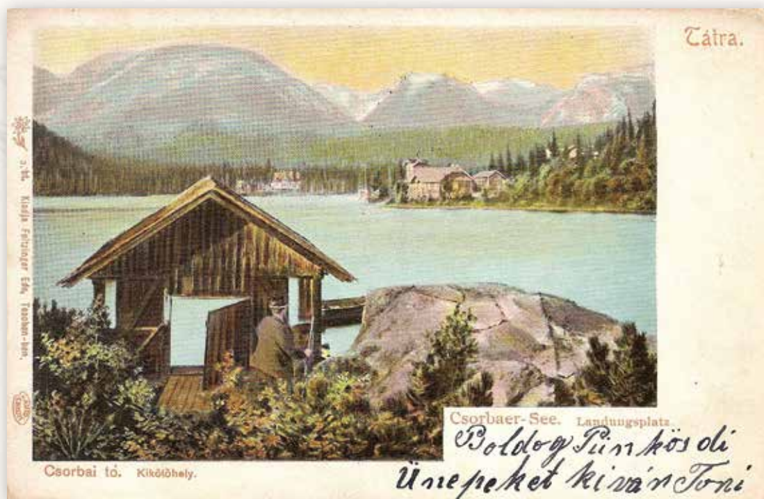
24) A csónakkikötő a Csorbai-tó déli partján